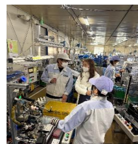
ベトナム実習生の様子

組合来社時に実習生への現場での作業指導及び教育を実施しています。決め事の理解度確認や安全面の指導を行いました