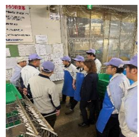
中国実習生の様子